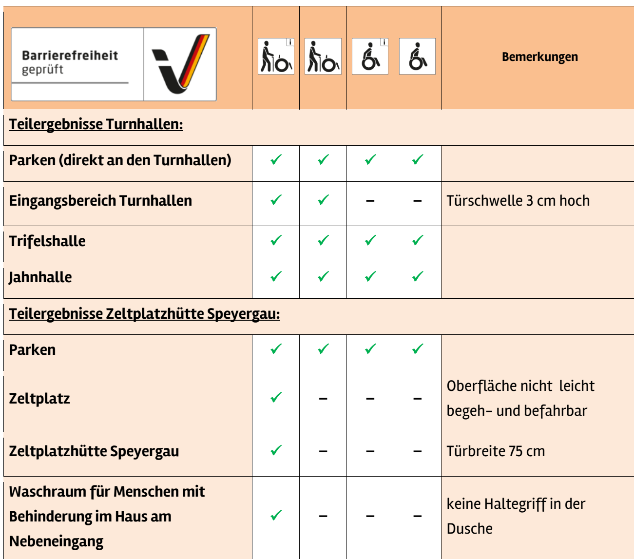
Tabelle 1: Überblick über das Prüfergebnis